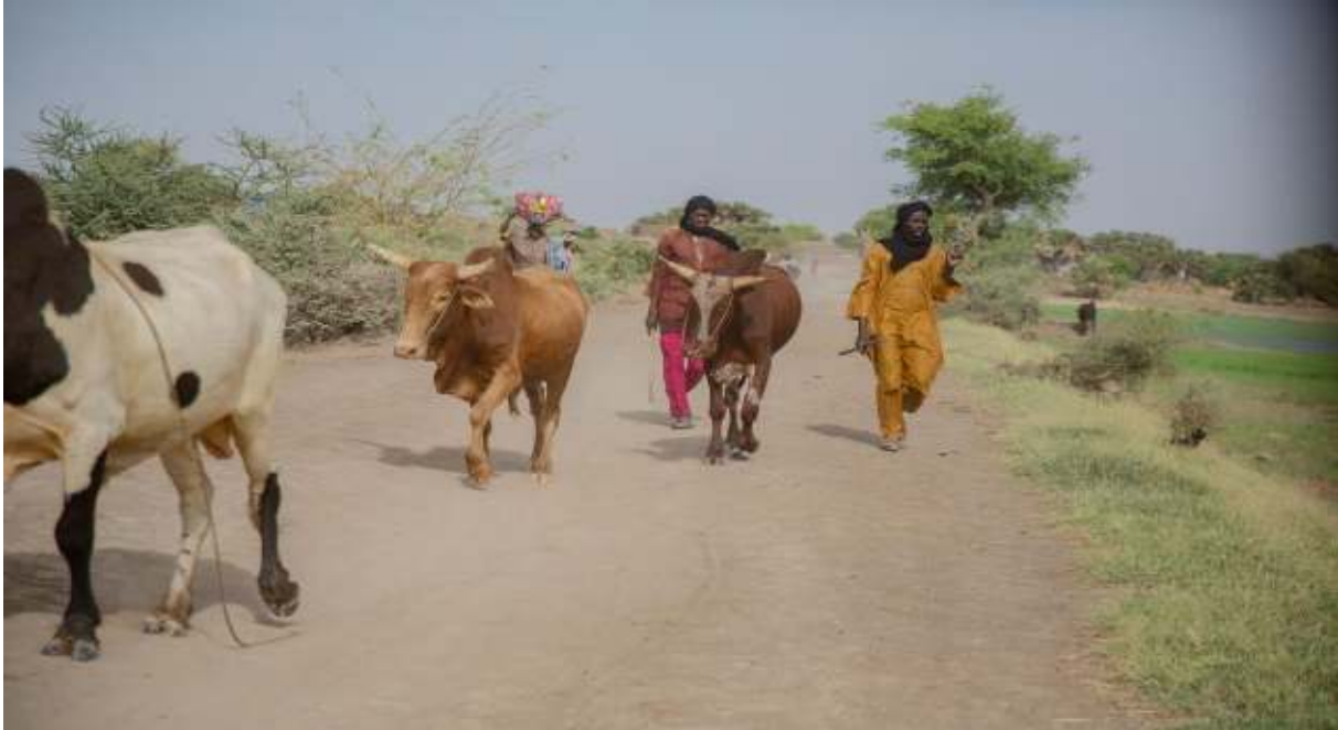
Des bergers Peulhs derrière leur troupeau à Gao ©RENEDEP, septembre 2021.

pardonnent... Et là nous étions obligés de prendre un représentant de N'Tillit pour gérer tous les problèmes de cette localité et un représentant pour Tessit pour gérer tous les problèmes de Tessit. Au niveau du HCR, nous avons dit que ce sont ces deux responsables qui répondent au nom de ces populations suivis par un membre de la Coordination» 54 .