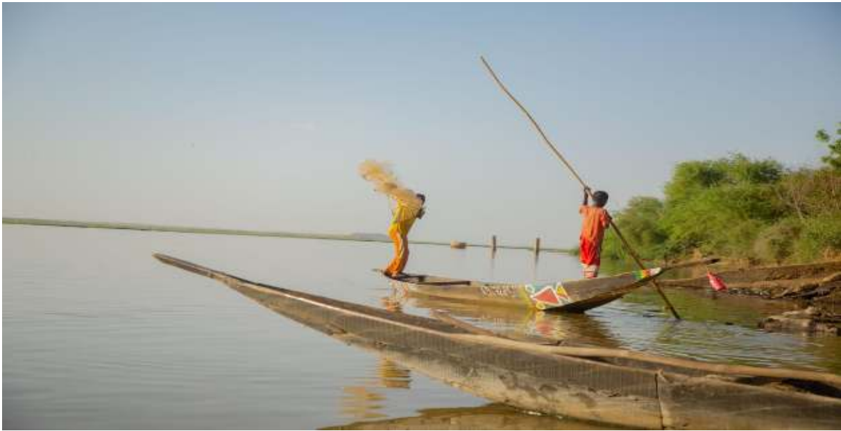
Deux enfants sorkos dans leur pirogue sur le Niger à Gao ©RENEDEP, septembre 2021.

Le « Bonkoyno » est le chef coutumier ou traditionnel chez les Songhoï. En règle générale, le statut de « Bonkoyno » est héréditaire. En matière de gestion des conflits, le Bonkoyno peut être présenté comme le « garant et le grand témoin ». La gestion des conflits relève naturellement des attributions du Bonkoyno en tant que fonction sociale. Sur ce point, un chef coutumier songhoï de la région de Gao explique qu'il faut gérer les conflits parce que « la quiétude sociale, c'est la chose la plus importante sur cette terre » et que les conflits doivent être gérés parce qu'il faut chercher à « éviter la pire des choses qui est qu'un problème lui-même apporte une solution qui peut être la pire des solutions ».